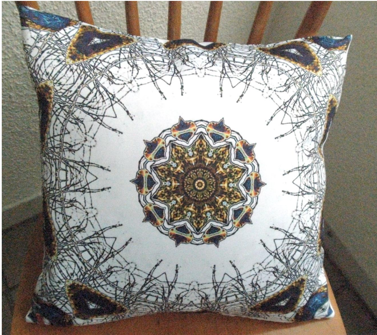
Cushion „Cosm No. 1“ Zierkissen „Cosm No. 1“